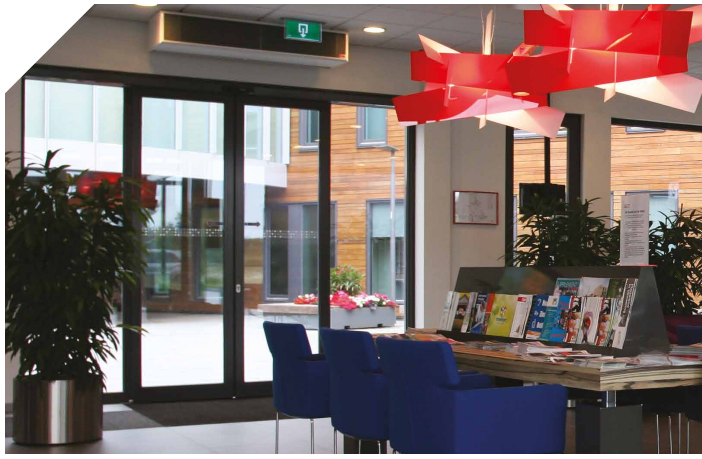
JCC Software schikt zich graag in regie gemeente